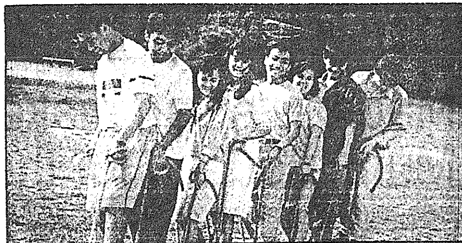
TIME off for leisure at Morning Glory camp site