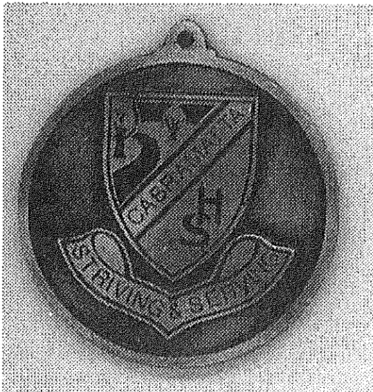
At left: Face of the School Medal