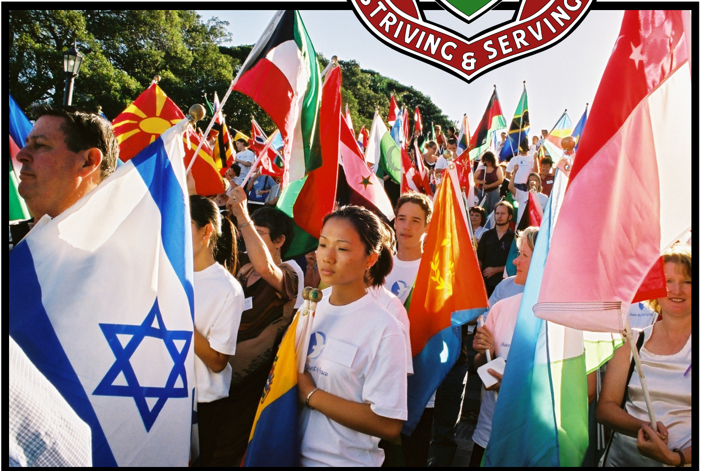
Students and teachers supporting peace at the Peace Summit

A School Community Newsletter Number 45 April, 2003