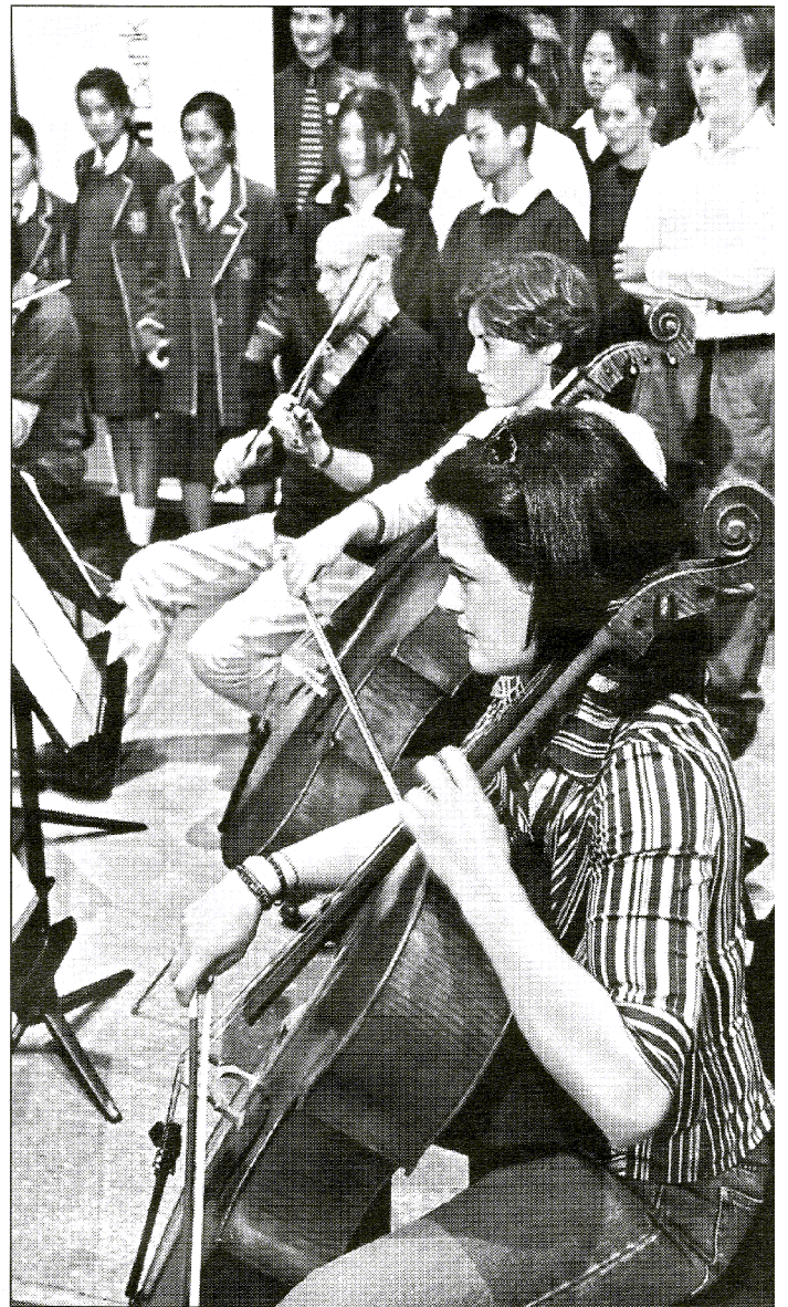
Keen observers: the ACO at rehearsal watched by students

□ For details of the ACO education programs phone 8274 3800.