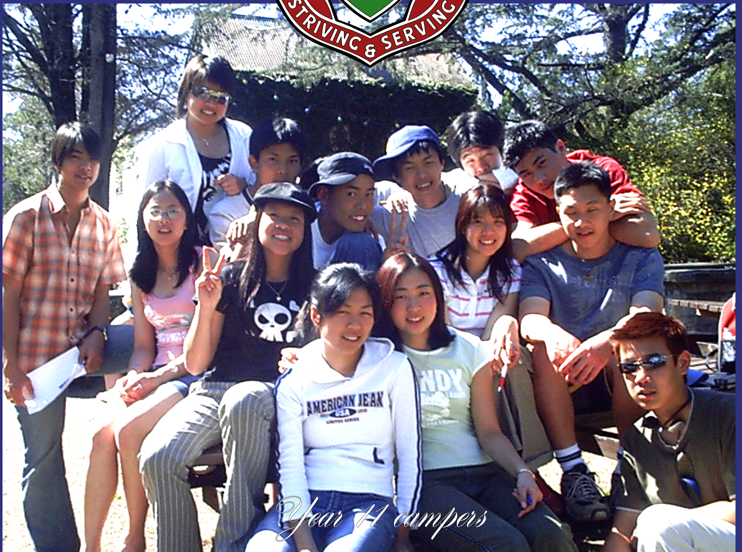
Year 11 campers

A School Community Newsletter Number 50 October, 2004