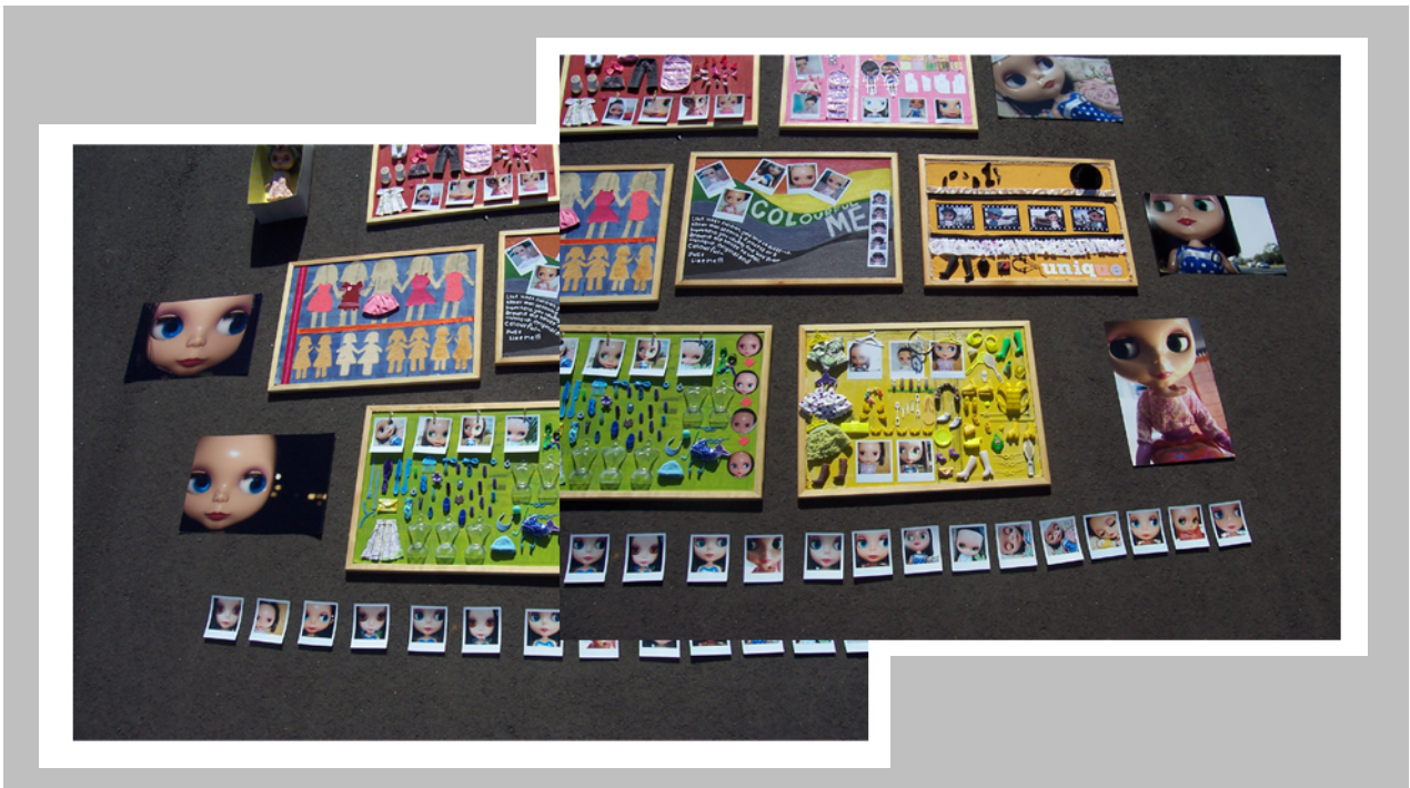
Cindy tran "The Blythe Identity" Collection of Works