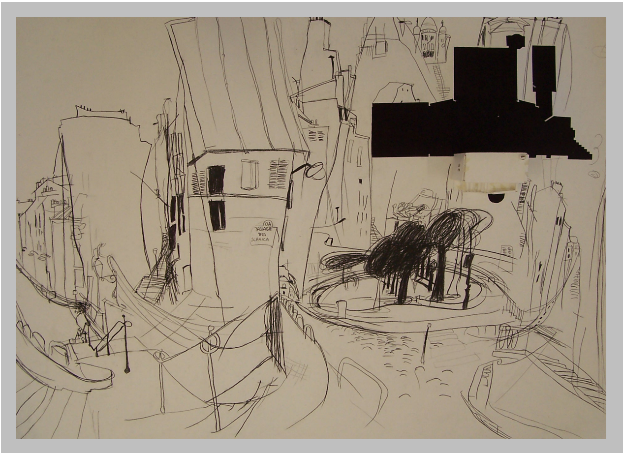
Titiana Petrovic "Split Seconds of Scribble" Drawing