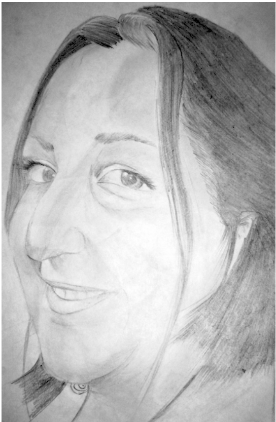
Portraits by Cabramatta High School students