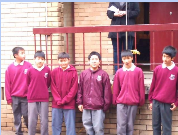
Year 8 Team