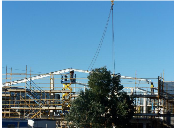
Block 6 progress 15/5/2013