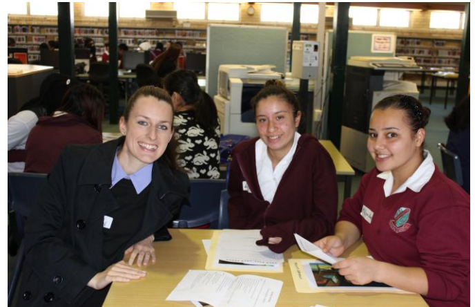
2013 YFYS Commonwealth Bank mentors and students from Cabramatta High School