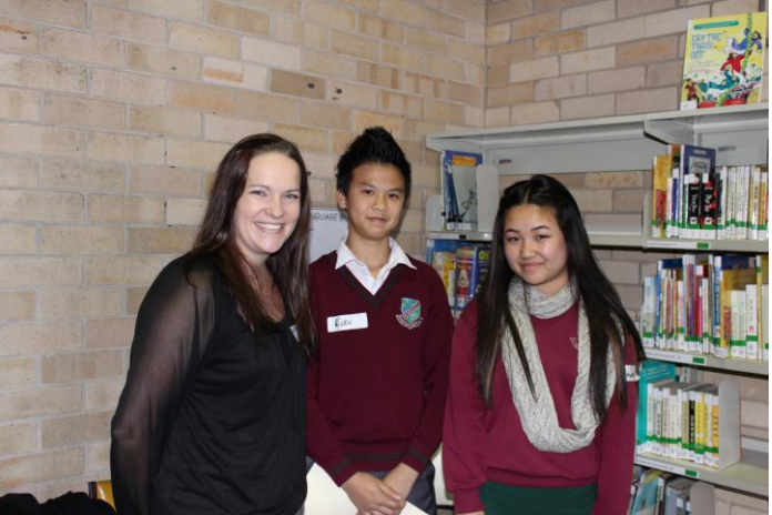
2013 YFYS Commonwealth Bank mentors and students from Cabramatta High School