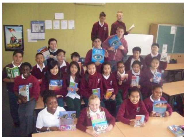
7RC2 with their book prizes.

With regular practice, students will develop good reading habits that will help them prepare for life beyond high school. Each fortnight a tally update will be announced in Kalori and the winning roll call class will be announced at the start of next term. Happy Reading School