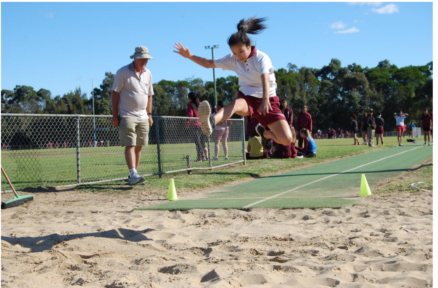
2013 ATHLETICS CARNIVAL