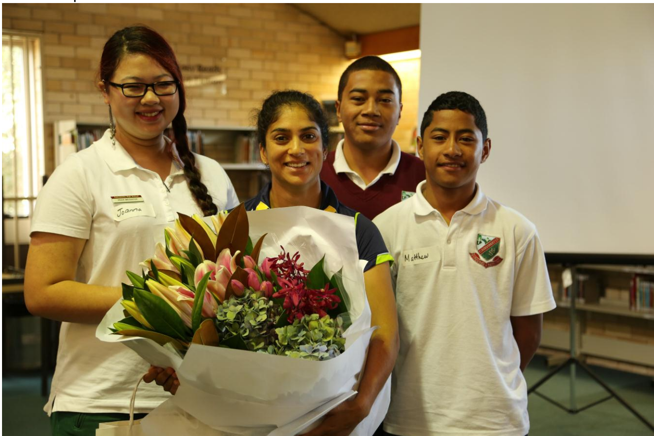
Lisa Sthalekar with the year 9 students

The teachers at the school along with the mentors from the CBA have guided the students in the writing process. The students recently visited the Art Gallery of NSW, where they visited the Archibald exhibition with their CBA mentors. During this visit the mentors read through the first draft of the stories providing students with feedback for the final draft